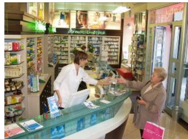
Zagreb – Pod zidom