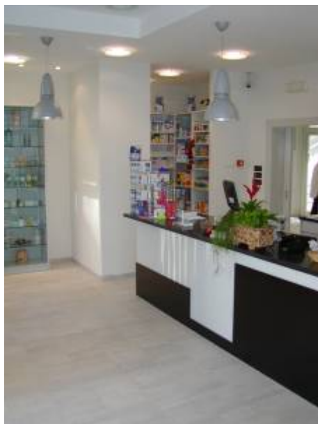
Zagreb – Vidrićeva