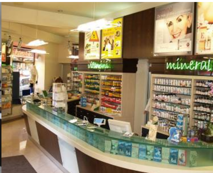
Zagreb – Pod zidom