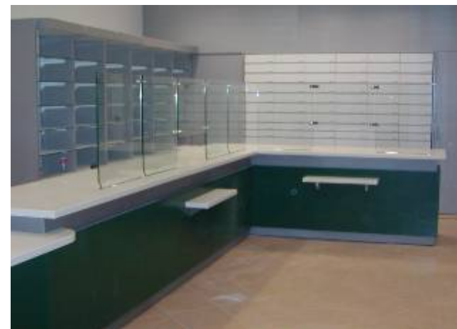
Gradiška – Apoteka Kalenić