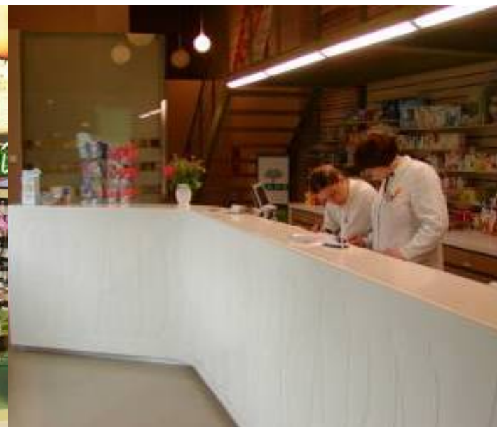
Zagreb – Karlo Gradska apoteka