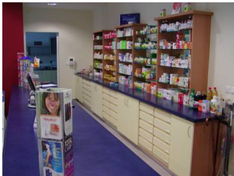
Split – Zelina apoteka